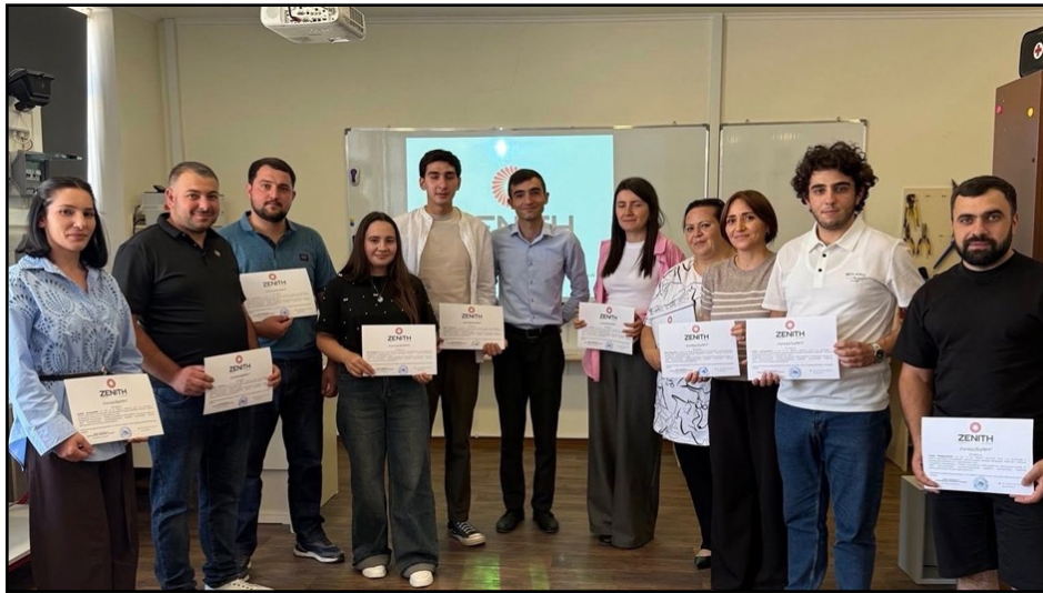
Les nouveaux diplômés de la session d'août

Pour la première fois, l'Académie a appliqué un format hybride de formation, permettant à un plus grand nombre d'étudiants – 24 au total – de participer en ligne du 11 au 18 août à la phase théorique du cours. Ensuite les 10 participants ayant obtenu les meilleurs résultats ont participé du 25 au 27 août à la session pratique de la formation au centre de formation technologique de Sevan. Grâce à la formation, ils ont acquis :