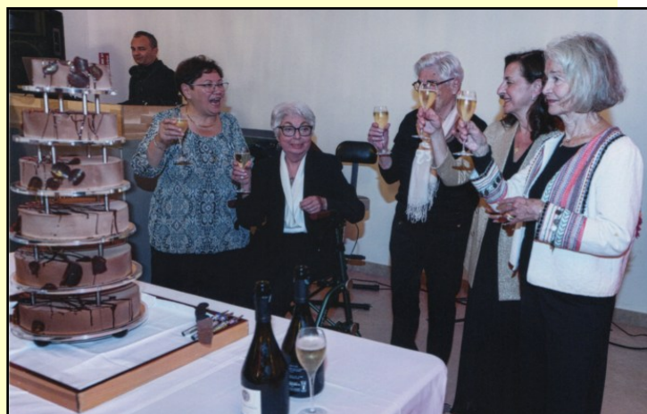
Les épouses des présidents successifs sont également honorées pour leur participation aux côtés de leurs époux