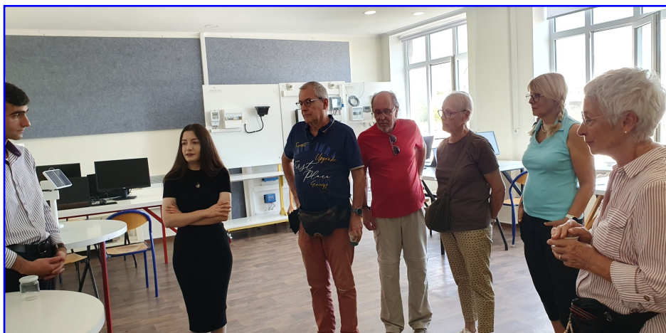
Les visiteurs apprécient les conditions ludiques qui animent l'enseignement