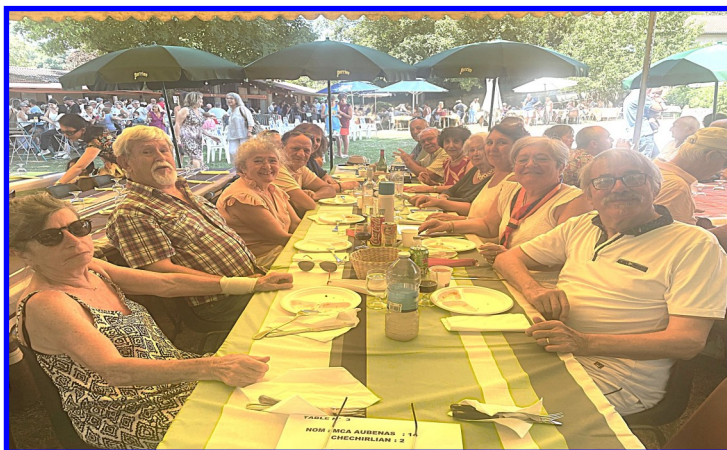
L'association en partage d'amitié au Tacht de Romans

Côté culturel l'association envisage une future conférence sur le génocide.