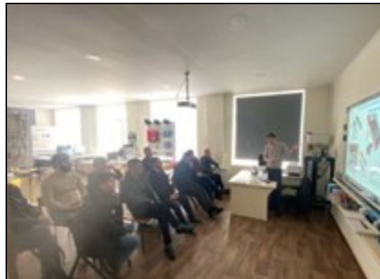
1ère formation des adultes en 2025

En septembre est lancée le projet de formation de 5 semaines en énergies renouvelables.